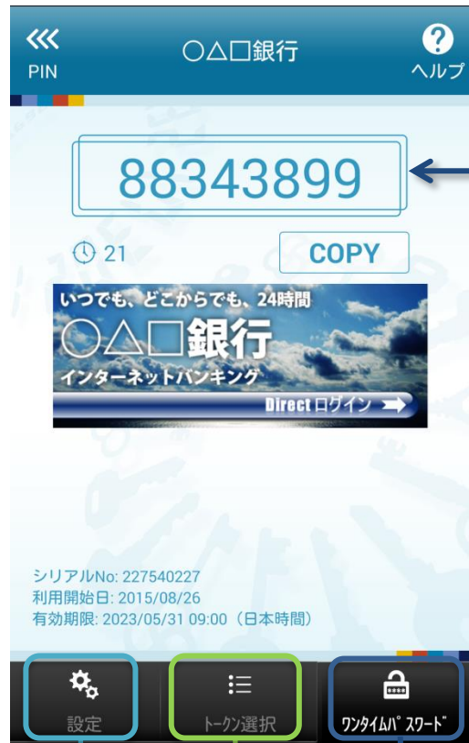
ワンタイムパスワード表示画面