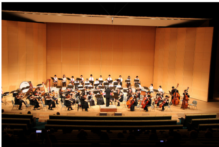
かずさジュニアオーケストラ 第15回定期演奏会 協賛