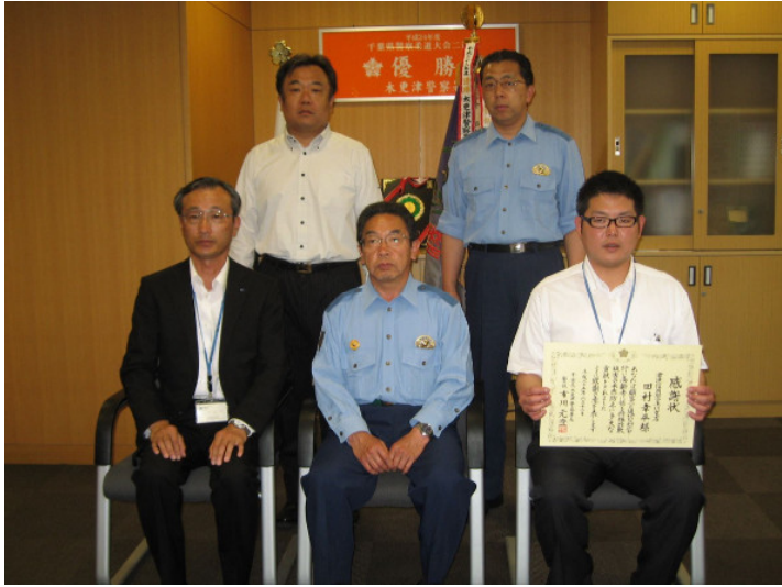
平川支店 (25年6月) 於：木更津警察署